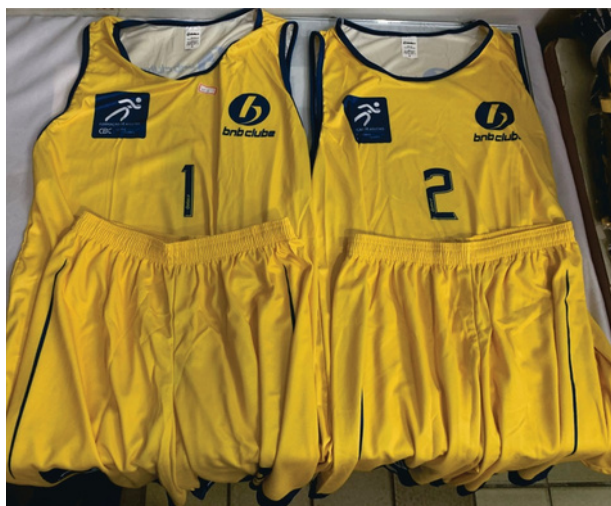
Uniforme de Competição Conjunto Masculino