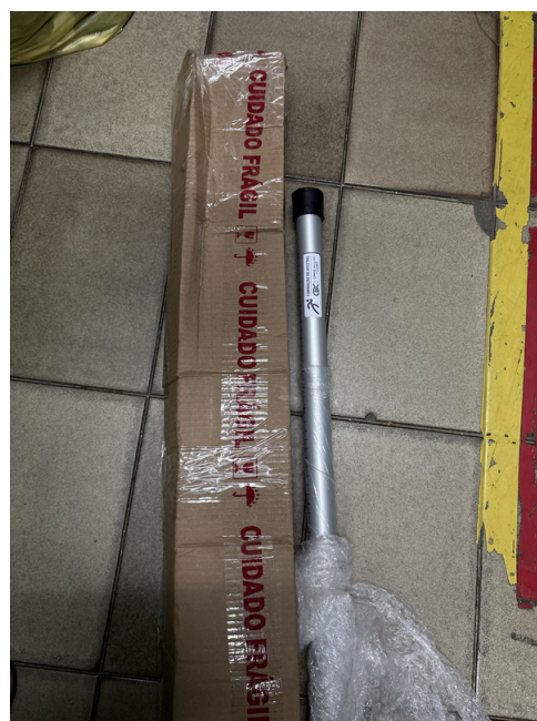
Régua de medição