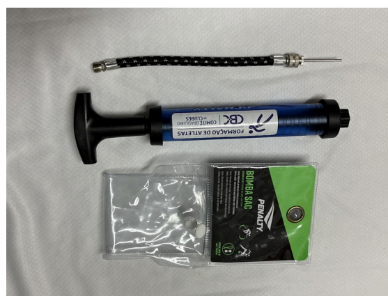
Bombas de encher bola