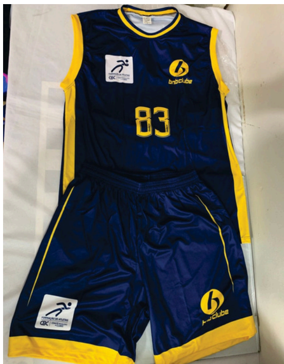
Uniforme de Competicao Conjunto masculino