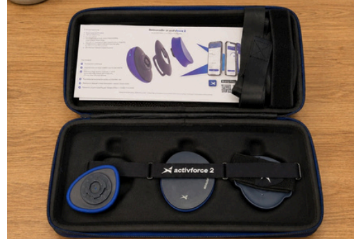
Goniometro e Dinamometro