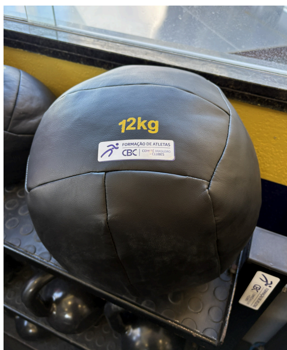
Wall Ball 12kg