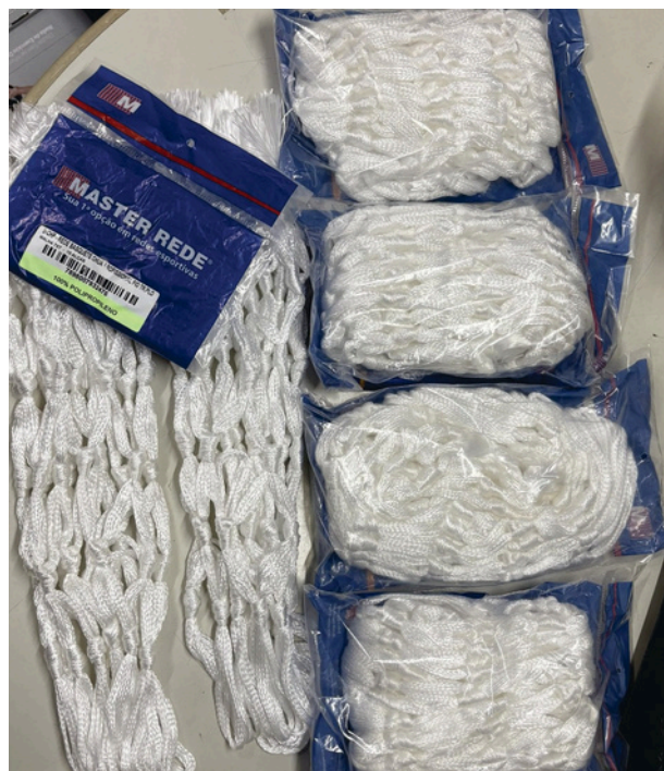
Rede para Aro de Basquete