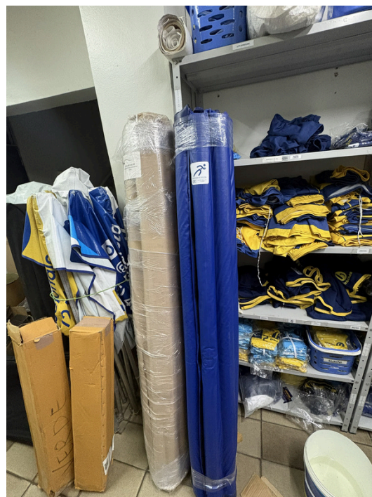
Protetor de Poste