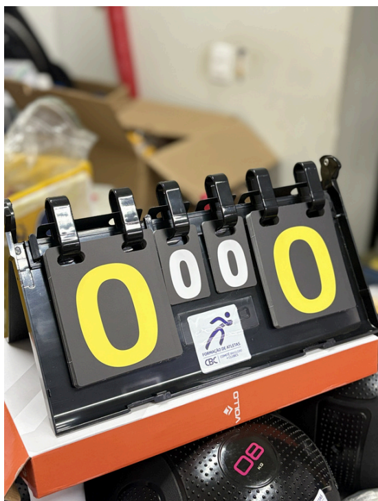
Placar de Mesa