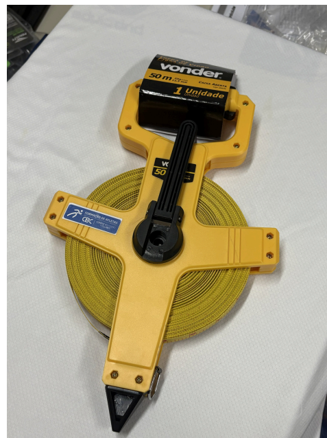
Trena de 50m