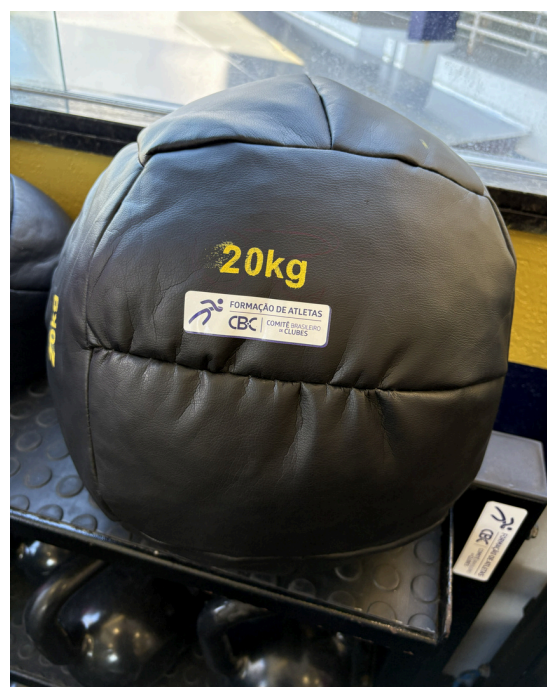
wall ball 20kg