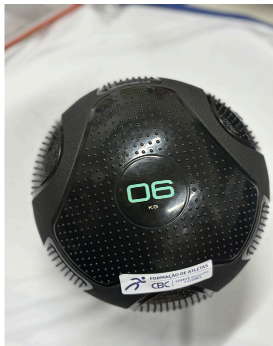
Slam Ball 6kg