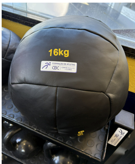
Wall ball 16kg