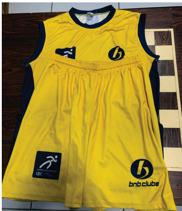
Uniforme de Treino Masculino