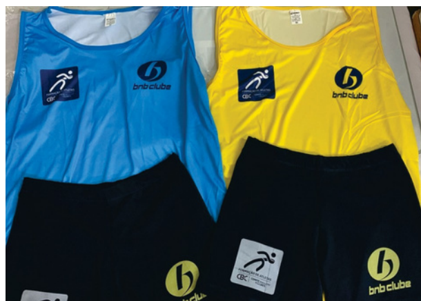
Uniforme de Treino Conjunto feminino