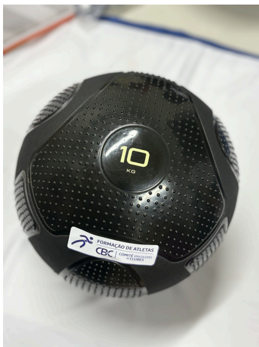
Slam Ball 10kg