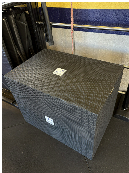
Caixa de Saltos