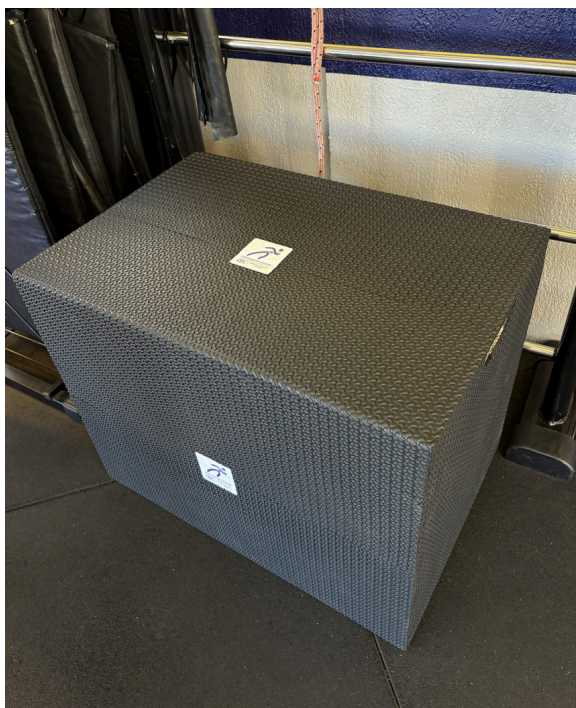
Caixa de saltos acolchoada e regula