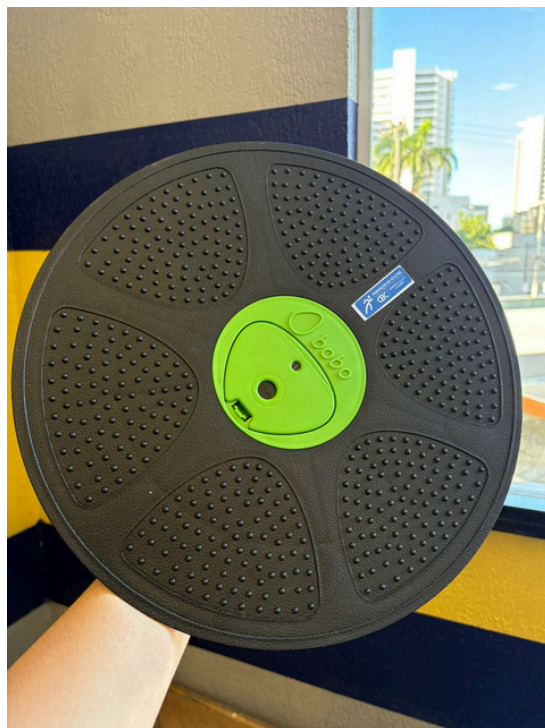
Plataforma de equilíbrio