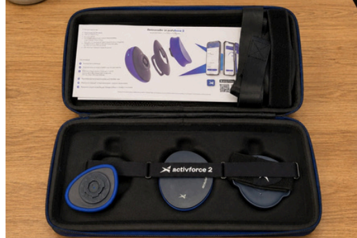
Goniometro e Dinamometro