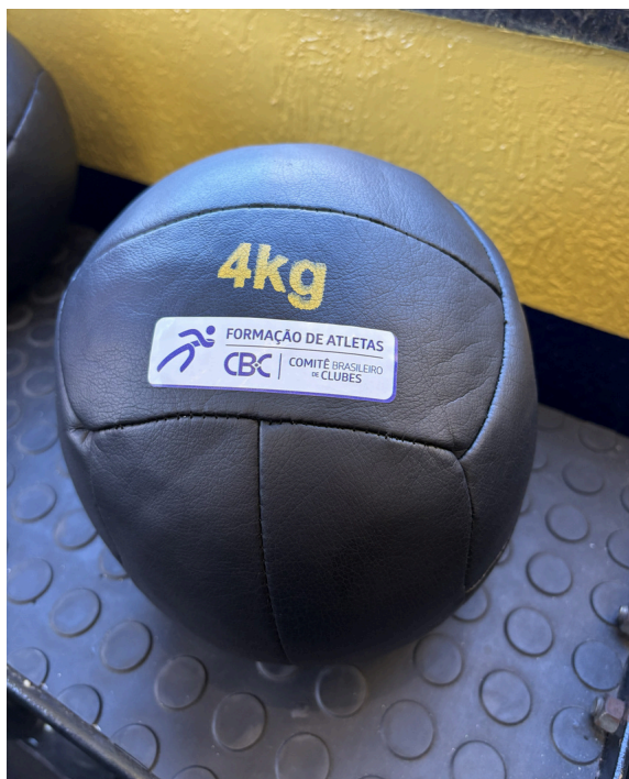
Wall Ball 4kg