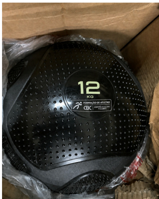
Slam Ball 12kg