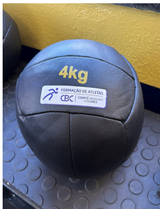
Wall Ball 4kg