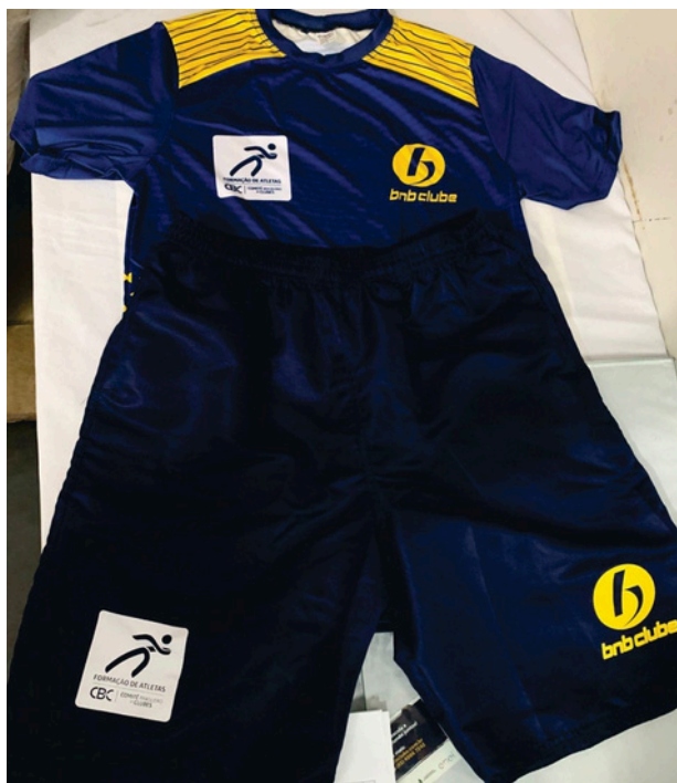
Uniforme de Viagem Passeio Conjunto masculino