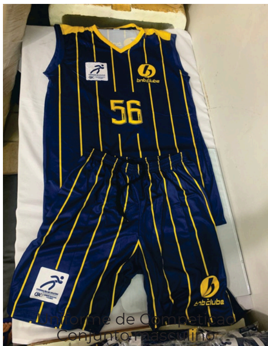
Uniforme de Competição Conjunto masculino