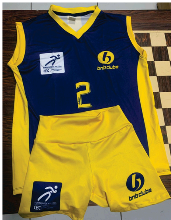
Uniforme de Competicao Conjunto feminino