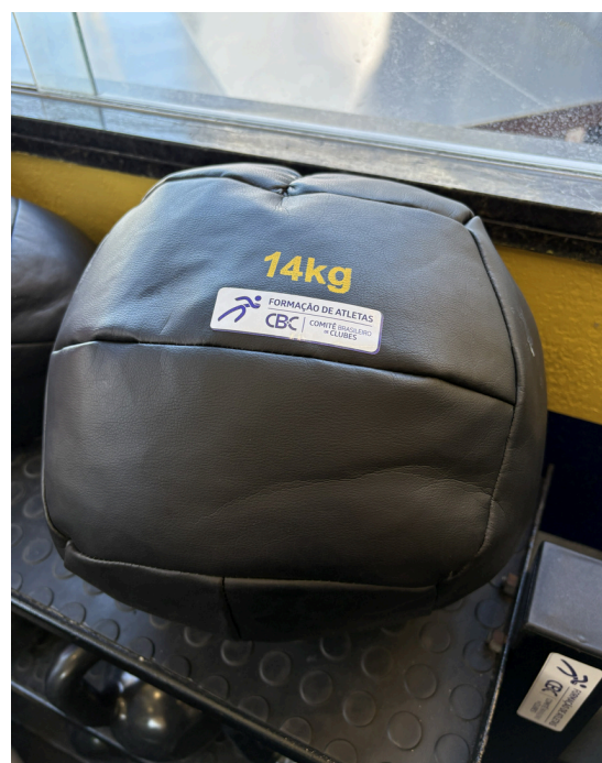
Wall Ball 14kg