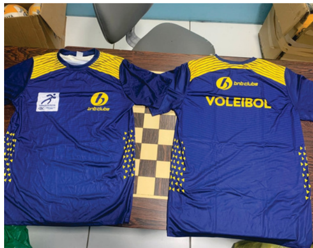
Uniforme de Viagem