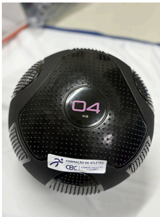
Slam Ball 4kg