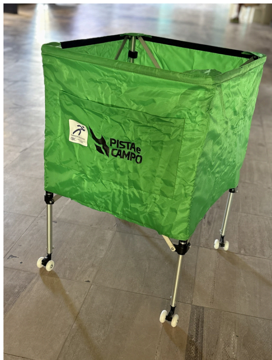
Carrinho de Bolas de Voleibol