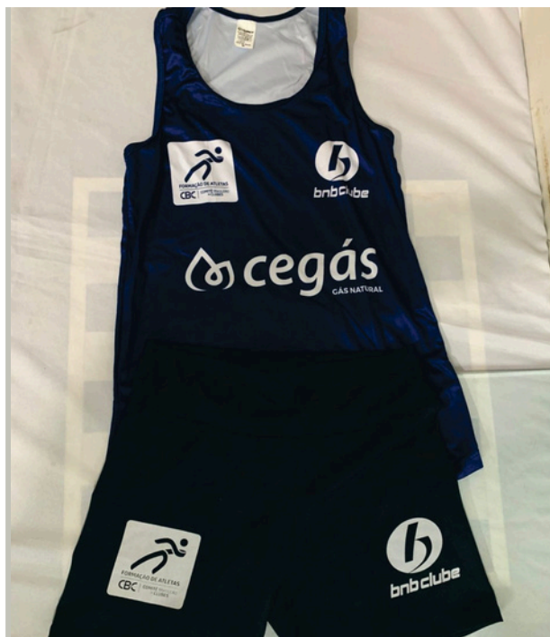
Uniforme de Treino Conjunto masculino