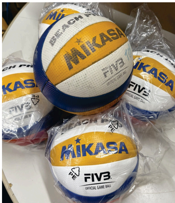
Bola de Vôlei de Praia