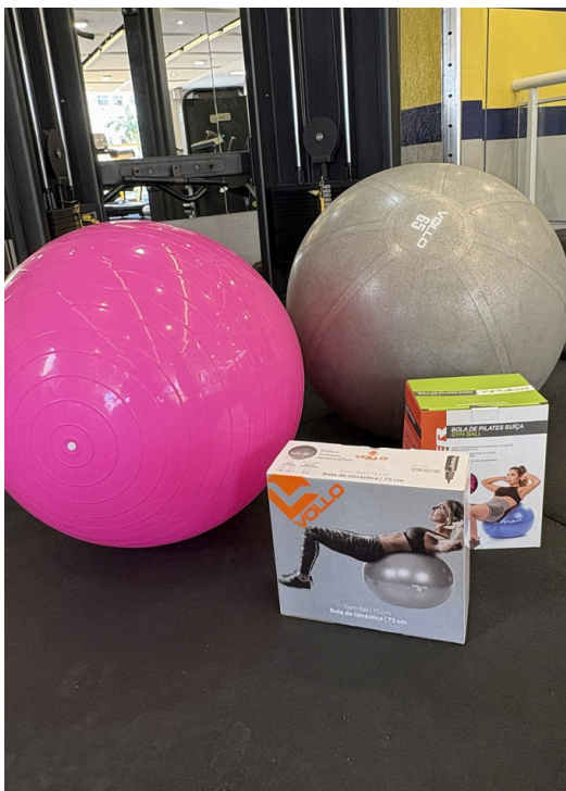
Bola de pilates extra grande