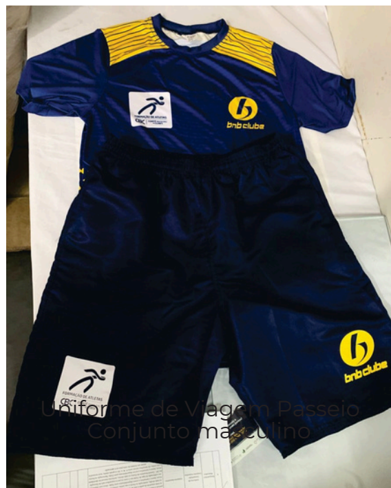
Uniforme de Viagem Passeio Conjunto masculino