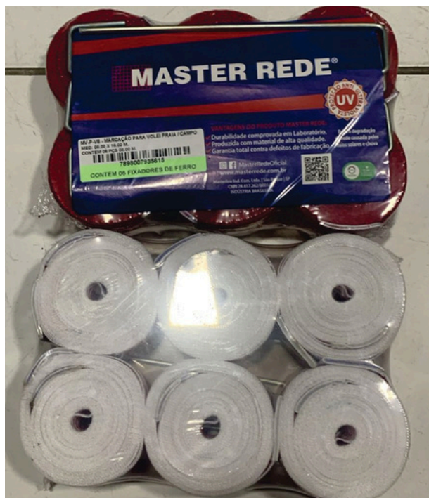
Fita de Marcação