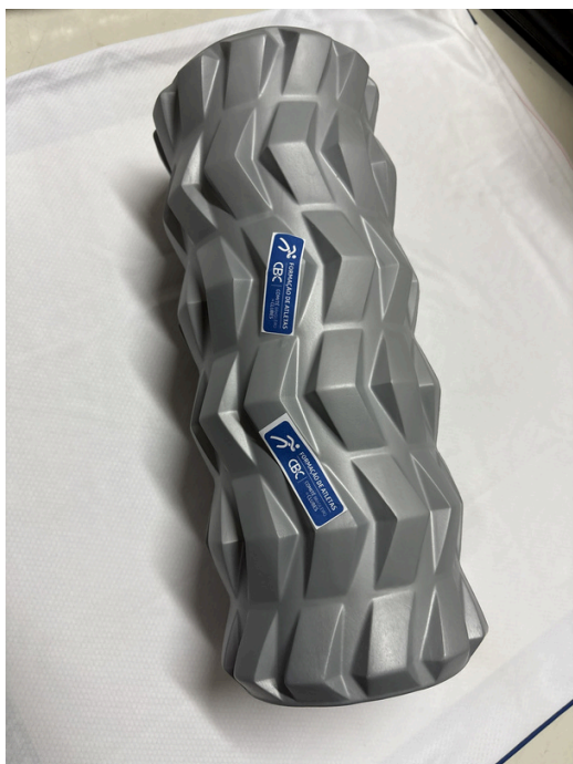
Rolo de liberação