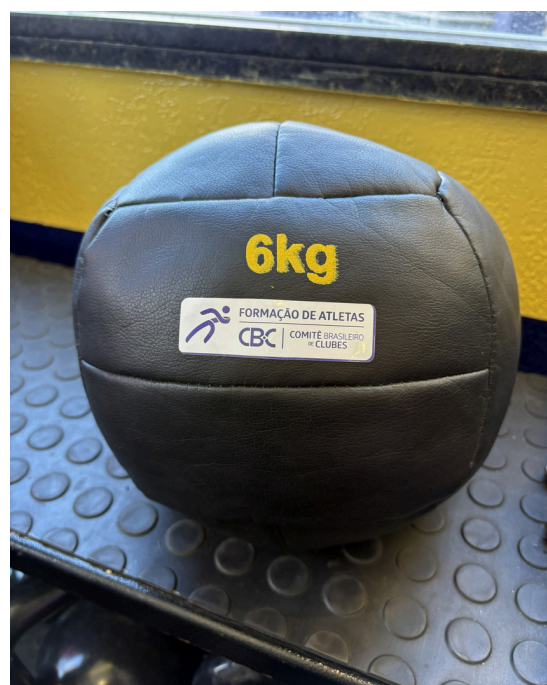
wall ball 6kg