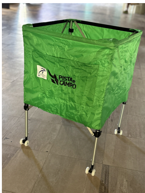
Carrinho de Bolas de Vôlei de Praia