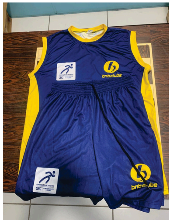
Uniforme de Treino