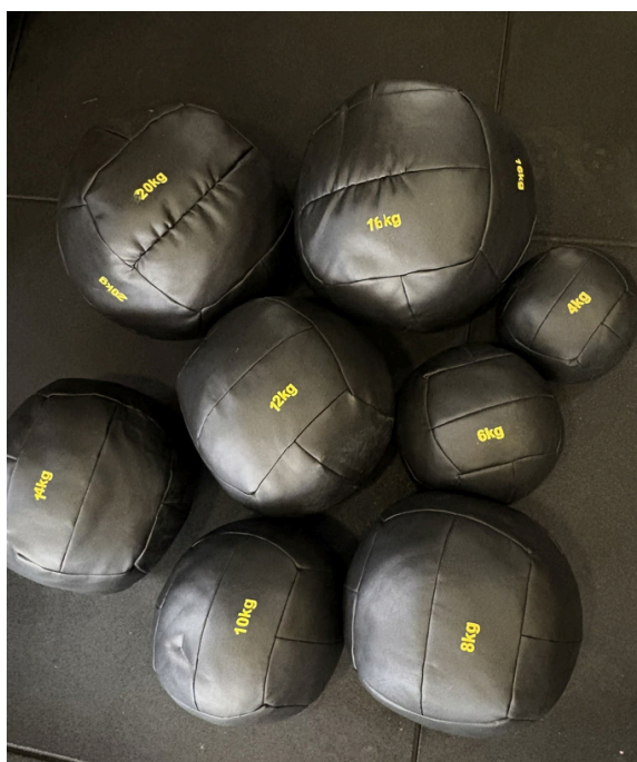
Wall ball todos os tamanhos