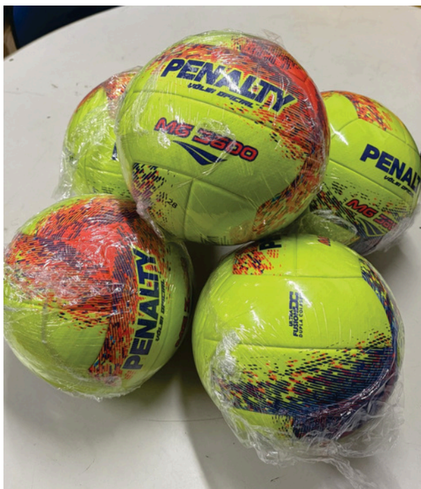
Bola de Vôlei Especifica para Levantadores