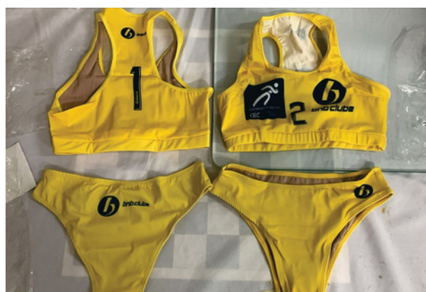
Uniforme de Competição Conjunto feminino