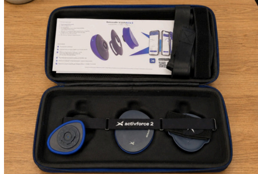
Goniometro e Dinamometro