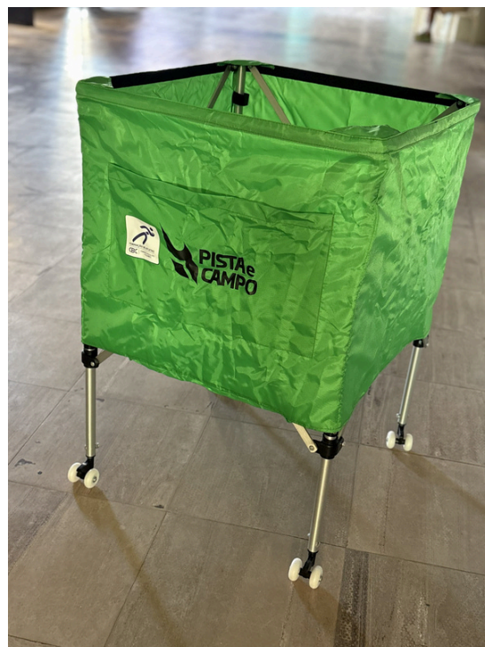
Carrinho de Bolas de Voleibol