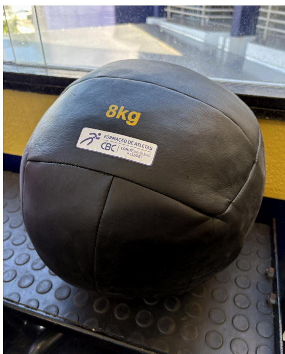
Wall Ball 8kg