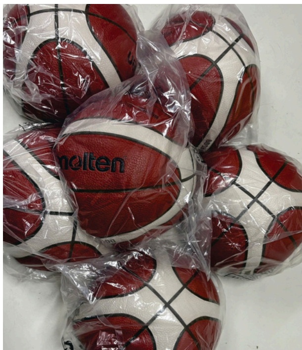
Bola de Basquete Masculino Molten