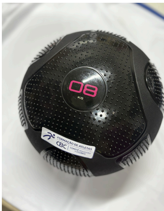
Slam Ball 8kg