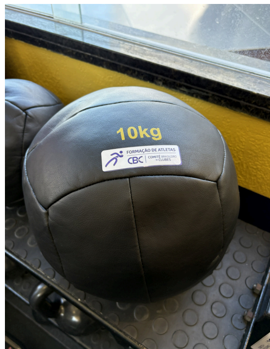
Wall Ball 10kg