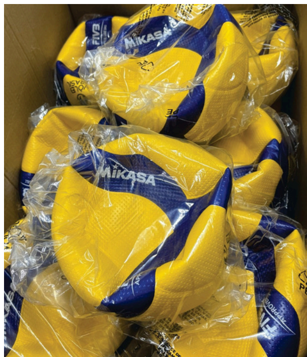
Bola de Voleibol