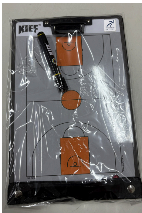
Prancheta de instrução Técnica