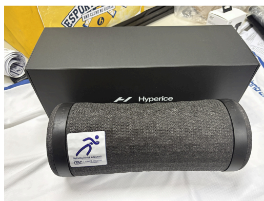
Rolo de Vibração