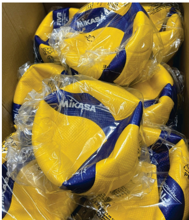
Bola de Voleibol