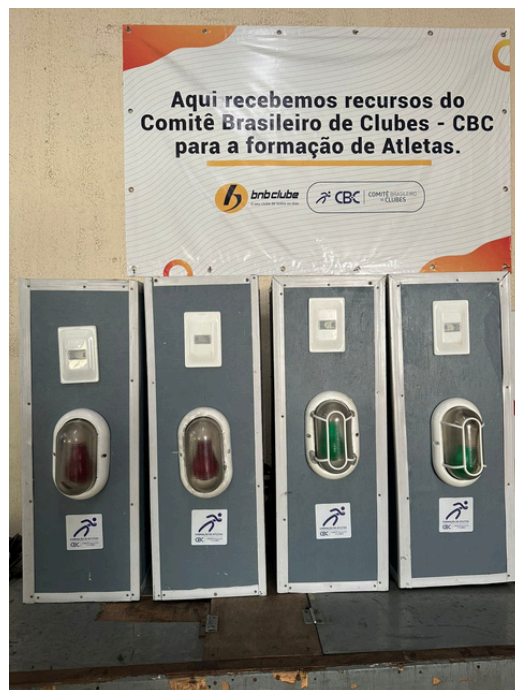
Campaina com temporizador