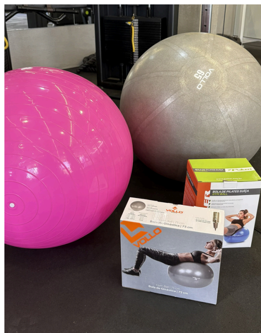
Bola de Pilates