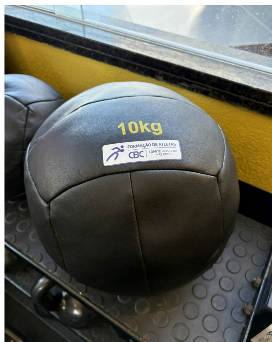
wall ball 10kg